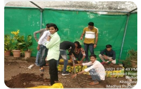
मशरूम की खेती